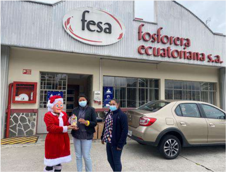
CDI LA ARGELIA